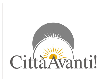
logo del Movimento culturale, politico, pratico Città Avanti