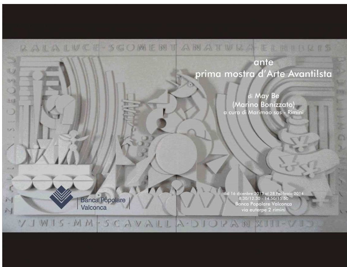
prima pagina del catalogo "ante - prima mostra d'Arte Avanti!sta" (pannello in resina "INCULTUM" ml. 4x2)

il primo MdF pervenuto riguarda l'Arte e racconta come l'Arte Vera o Avanti!sta sia determinante per la conquista, la difesa e l'evoluzione della nuova Città ... perché solo lei è capace: di raggiungere e far esplodere il senso del bello che sta al centro del nostro sole privato; di renderci quindi consapevoli dell'orrido che ci accerchia; di innescare conseguentemente una rivolta globale ( pacifica perché all'insegna del bello) contro il Sistema che tale orrido produce.